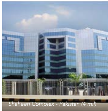
Shaheen Complex - Pakistan (4 mil)

☐ AC 4 mil Clear ☒ AC 7 mil Clear ☐ AC 8 mil Clear