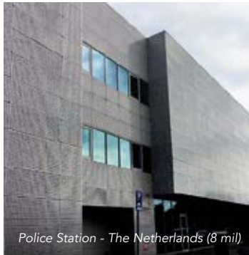
Police Station - The Netherlands (8 mil)

Armorcoat® est non réfléchif et donc virtuellement invisible sur vos fenêtres, jour et nuit. Les couches de polyester hautement résistantes, les adhésifs extrêmement performants offrent une atténuation considérable des effets de l'éclatement et une très grande capacité de résistance aux impacts.